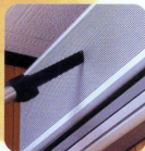
●エアコン、ファンヒーター等 (すきまノズル)