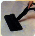
●布団、毛布 (パワースル)