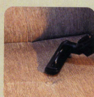
●ソファ等の厚手の布地 (6インチスルブラシ)