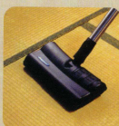
●たたみ (パワースル)