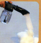
●スプレーガン、サッドサー サッドコンセントレイト じゅうたんクリーニング