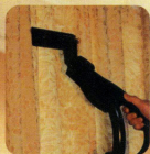
●カーテン、薄い布地 (6インチノズルプラン)