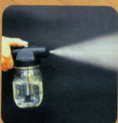
●スプレーガン 網戸、網戸洗い