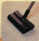
●じゅうたん、カーペット (パワースル)