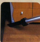
●すみ、すきま、狭いところ (すさまノズル)