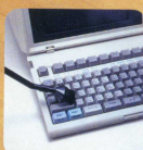
●ミニ・ヴァック パソコン、OA機器、ミシン等 ブラシ2本、ノズル1本セット