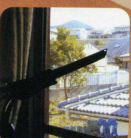
●網戸 (すさまノズル)