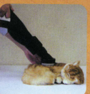
●マッサージユニット ペットのトリミング