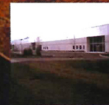
ヘルスマア本社工場