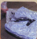
●布団の圧縮クリーニング (6インチスルブラシ)