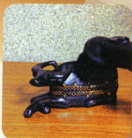
●家具、置物 (円形ブラシ)