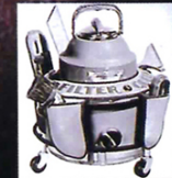
1928年製の第1号掃除機