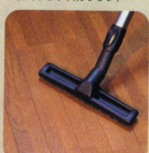
●フローリング、Pタイル等の床 (12インチフロアブラシ)