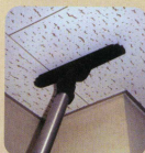
●天井、壁 (12インチフロアブラシ)